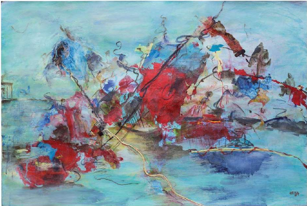
Le radeau des migrants